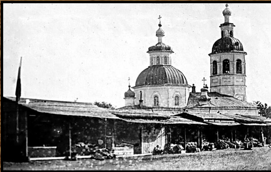
Помещения Сталинградского танкового училища во время эвакуации в г. Курган, 1941 год.